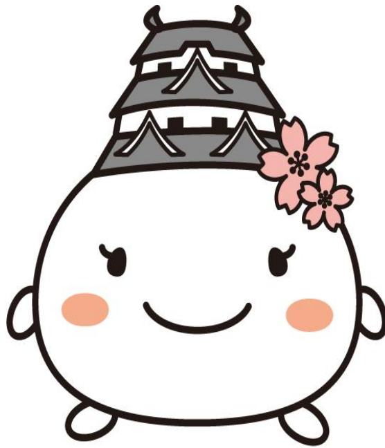
姫路市イメージキャラクター 「しろまるひめ」