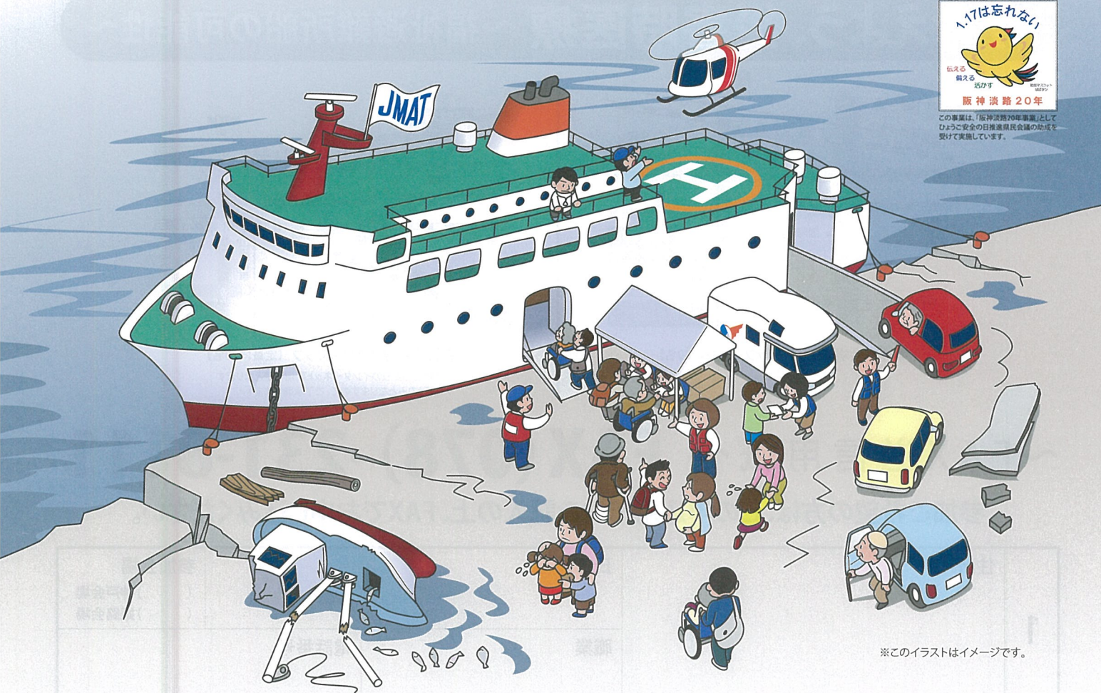
※このイラストはイメージです。

この事業は、「阪神淡路20年事業」として、ひよこ安全の日推進員養成講座の開催を受けて実施しています。