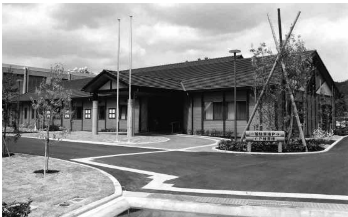
(姫路家畜保健衛生所)